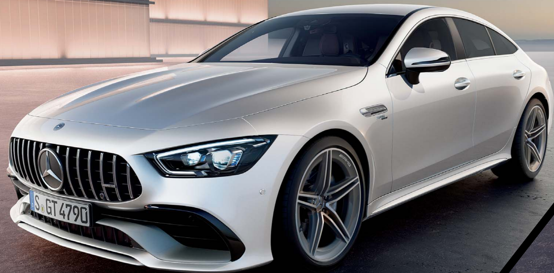
Mercedes-AMG GT 43 4MATIC+ (ISG搭載モデル)

ボディカラー：ダイヤモンドホワイト(メタリックペイント)(799)(有償オプション)