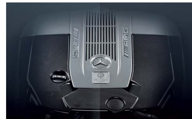
6.0ℓ V型12気筒ツインターボエンジン