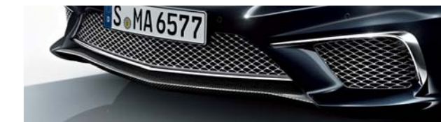
AMGカーボンファイバーフロントリップ