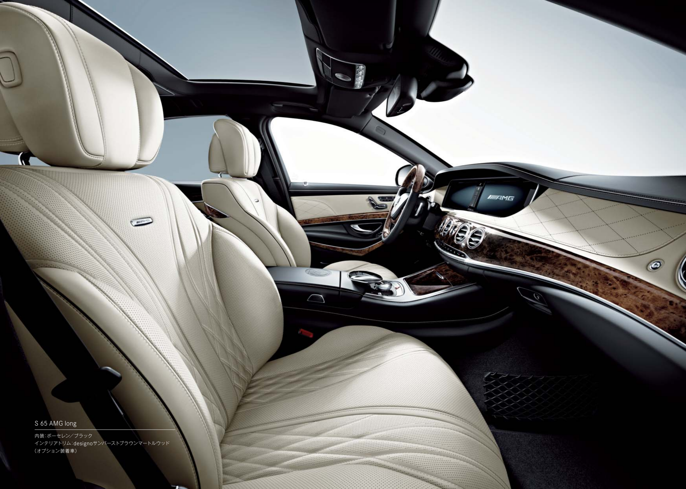
S 65 AMG long

内装:ポアセレン/ブラック インテリアトリム:designoサンバーストブラウンマートルウッド (オプション装着車)