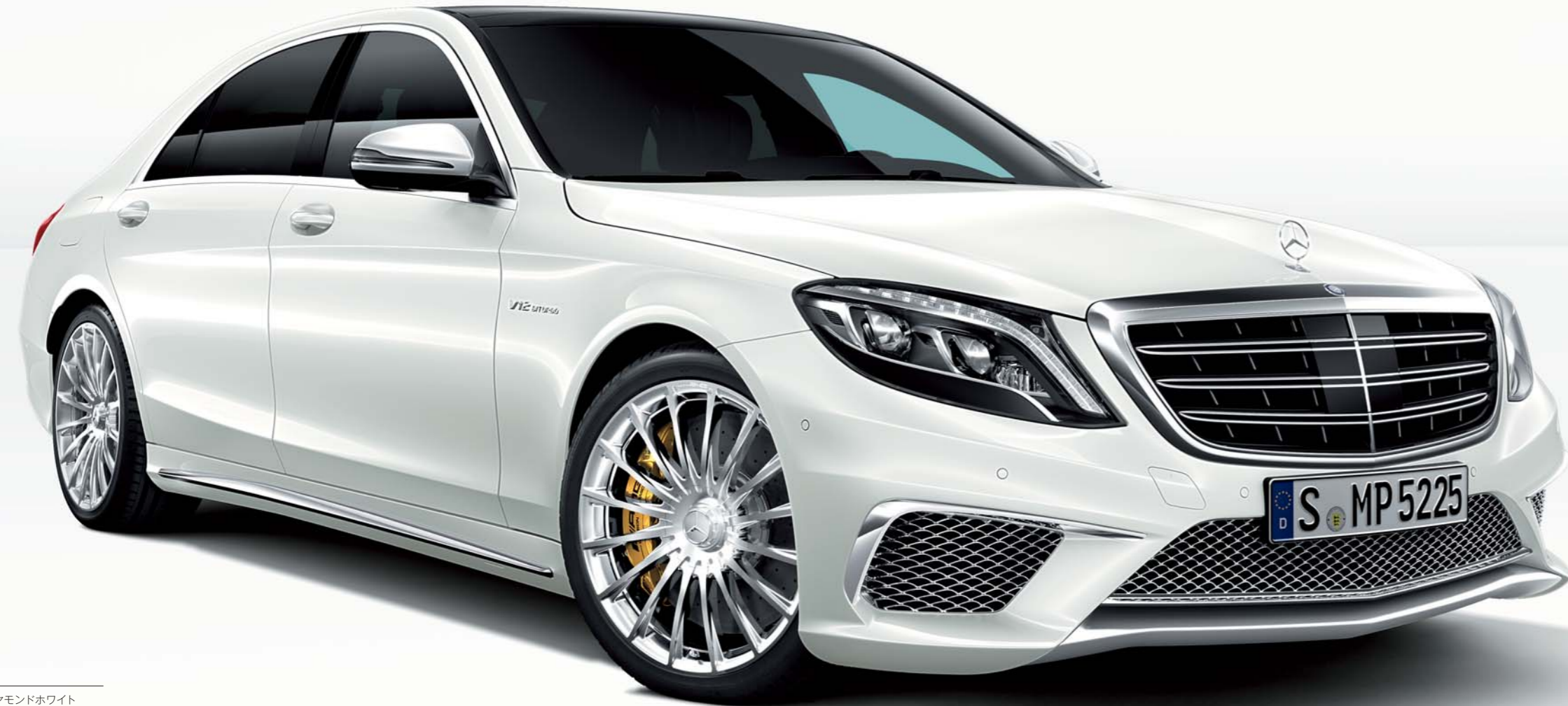
S 65 AMG long