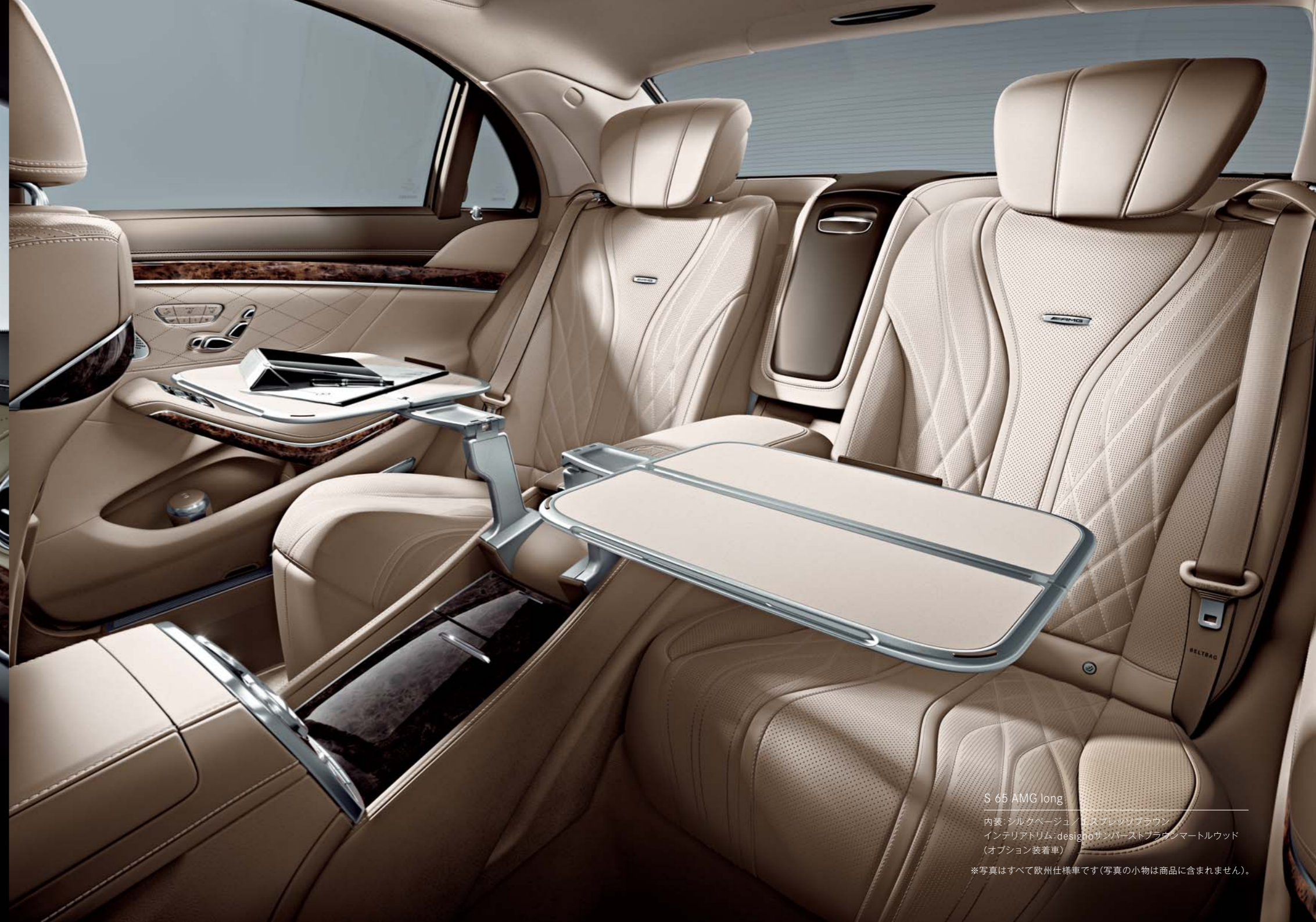
S 65 AMG long

内装:ポアセレン/ブラック インテリアトリム:designoサンバーストブラウンマートルウッド (オプション装着車)