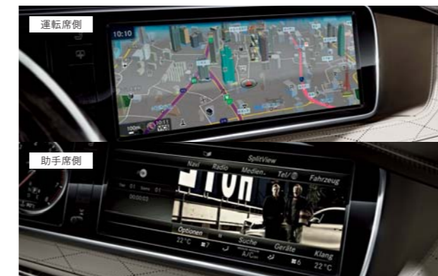
スプリットビュー

ダッシュボード中央の12.3インチTFTカラーセンターディスプレイには、運転席側と助手席側それぞれに異なる画像を表示できます。例えば、ドライバーがナビ画面を見ながら、助手席の乗員はDVDビデオを見ることが可能。助手席側では、マッサージ機能やクライメートコントロールといった快適装備の設定も行えます。さらにヘッドホンを使用して、ラジオ、インターネット、テレビ、外部入力を使ってMP3プレーヤー、ゲーム機、iPodなどが、上質なサウンドとともに楽しめます。