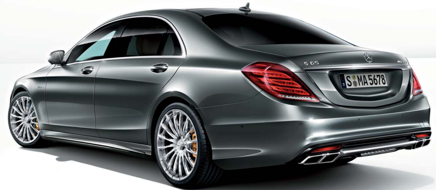
S 65 AMG long