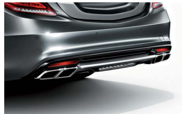
AMGスポーツエグゾーストシステム

マフラー内のエグゾーストフラップによって、エンジン音を切り替えるエグゾーストシステム。トランスミッションが燃費優先の「C(Controlled Efficiency)」モードのときはエグゾーストフラップを閉じることで、住宅街や街中はもちろん、長距離クルージングなどにも最適な落ち着いたサウンドを響かせます。ダイナミックな走りが味わえる「S(Sport)」、「M(Manual)」モードでは、エグゾーストフラップが開き、加速時やシフトダウンによる自動ブリッピング時などにAMG V12エンジンならではの、心ふるわせるサウンドが堪能できます。