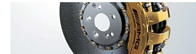
AMGカーボンセラミックブレーキ